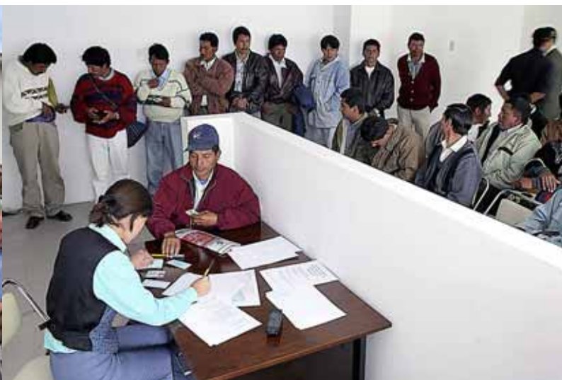
© IOM / Galo Paguay / Ecuador

Como perjuicio, la migración provoca una "fuga de cerebros" que afecta los recursos humanos cualificados de los países de origen, en sectores esenciales como