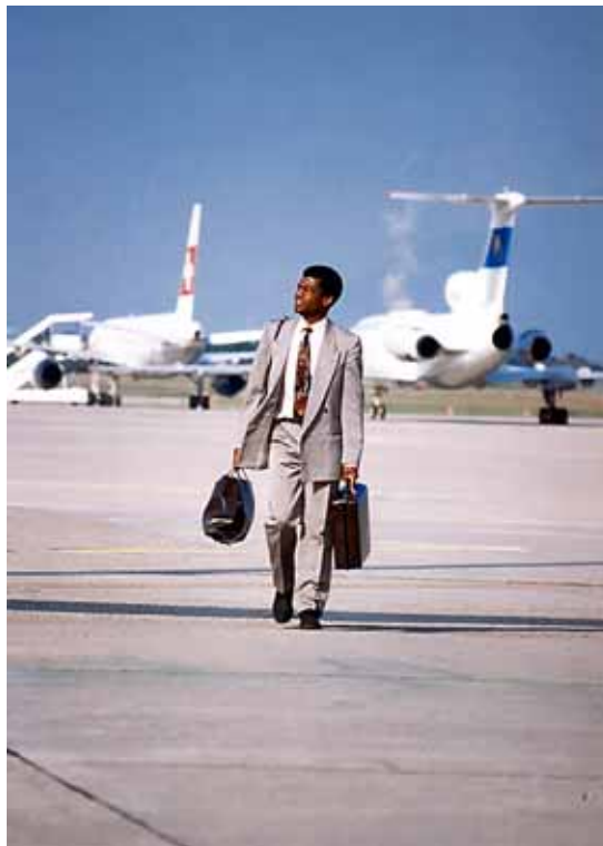
© IOM / Cemil Alyanak / Kenia

Avui en dia, tenim nombrosos exemples d'associacions de migrants que ajuden a la transformació de les seves comunitats d'origen enviant col·lectivament fons que serveixen per donar suport a projectes de desenvolupament i en els quals, sovint, hi participen també les administracions dels països d'origen i de destinació. D'altres, com és el cas del programa MIDA a Àfrica, promouen la transferència de coneixements