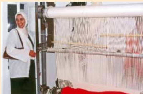
El Centre Talasemtane disposa d'una cooperativa tèxtil.

Los responsables del centro jurídico, durante una reunión de evaluación del proyecto.