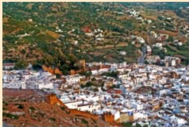
La ciutat emmurallada de Xauen. La ciudad amurallada de Xauen.

Proporcionar assessorament jurídic a les dones de la província de Xauen fou l'objectiu del projecte que, el 2003, emprengué