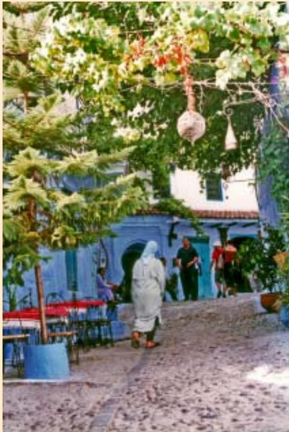
Les dones, vestides amb gel-labes o amb el vestit tradicional del Rif, es poden moure per espais públics, sense aixecar recels. Las mujeres, vestidas con chilabas o el traje tradicional del Rif, pueden moverse por espacios públicos, sin levantar recelos.