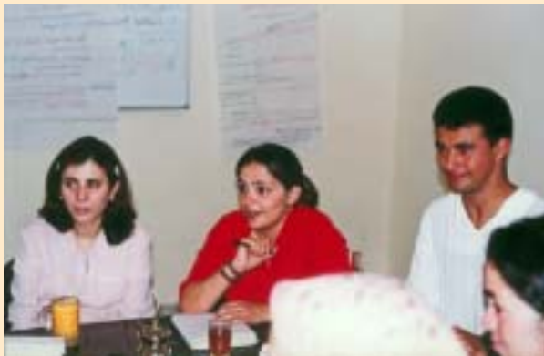
Els responsables del centre jurídic, durant una reunió d'avaluació del projecte.

Además de informar a las mujeres sobre sus derechos y deberes, en el centro se realizan seminarios sobre salud reproductiva, planificación familiar, enfermedades de transmisión sexual y cáncer de mama, y se imparten clases de alfabetización y de informática. La formación en las nuevas tecnologías de la información facilita el acceso de las mujeres al mundo laboral; sobre todo en una sociedad donde la esfera de lo público se adscribe al mundo masculino y la esfera