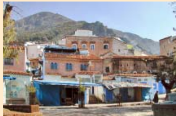
Assemblea de Dones realitza campanyes de sensibilització sobre els drets de les dones al Marroc. Assemblea de Dones realiza campañas de sensibilización sobre los derechos de las mujeres en Marruecos.

per donar a conèixer l'existència i les activitats del centre a les escoles, instituts, barris i llogarets, es fan acompanyar per homes per infondre més confiança en els seus receptors.