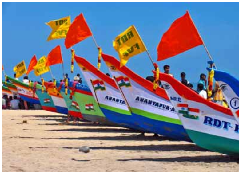
Fundación Vicente Ferrer

La Fundación Vicente Ferrer (FVF) , en colaboración con la administración local y estatal, les está prestando asistencia de emergencia aunque saben que este sentimiento de inquietud hacia el futuro, compartido por decenas de miles de personas de las zonas costeras del sureste asiático, no desaparecerá hasta que las promesas de reconstrucción se cumplan. Muchos habitantes de la región –pescadores, agricultores, ganaderos o artesanos– perdieron sus medios de vida tras el maremoto. Ahora, la FVF está suministrando los aparjos necesarios para que vuelvan a ejercer la pesca y la agricultura, e impulsa, a través de microcréditos y de otras acciones, la reactivación socio-económica de la región.