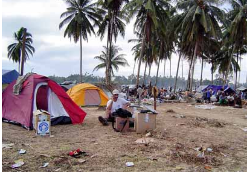
Médicos del Mundo

La Fundación Vicente Ferrer, implantada en el distrito indio de Anantapur desde hace tres décadas, ya prestó asistencia a la población del estado de Gujarat tras el terremoto de 2001. El proyecto que puso en marcha el día siguiente del tsunami, y que tendrá una duración de seis meses, se inició con el envío de dos convoyes con personal médico, ingenieros, logistas y productos de primera necesidad (alimentos, ropa de abrigo, agua, medicamentos, etc.) a las zonas costeras más afectadas de los estados de Andhra Pradesh y Tamil Nadu. Hoy, más de cuatro mil familias siguen recibiendo asistencia humanitaria de la FVF.