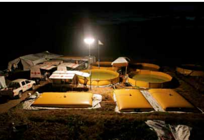
Cruz Roja / Craig Wood

havien quedat destrossats o contaminats per l'aigua de la mar. Amb aquesta finalitat es procedí a l'enviament d'una Unitat de Resposta a Emergències (ERU) especialitzada en aigua i sanejament, juntament amb sis tècnics que s'ocuparen del seu bon funcionament. La unitat, composta per cinc plantes potabilitzadores, té una capacitat de producció diària de 250.000 litres d'aigua d'alta qualitat per a hospitals i 500.000 litres per a consum humà, i disposa d'equipament de sanejament mediambiental.