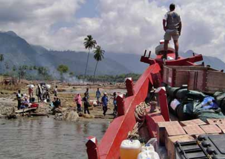
Médicos del Mundo

La Fundació Vicenç Ferrer, implantada en el districte indi d'Anantapur des de fa tres dècades, ja prestà assistència a la població de l'estat de Gujarat després del terratrèmol de 2001. El projecte que posà en marxa l'endemà del tsunami, i que tindrà una durada de sis mesos, s'inicià amb l'enviament de dos combois amb personal mèdic, enginyers, logistes i productes de primera necessitat (aliments, roba d'abric, aigua, medicaments, etc.) a les zones costaneres més afectades dels estats d'Andhra Pradesh i Tamil Nadu. Avui, més de quatre mil famílies continuen rebent assistència humanitària de la FVF.