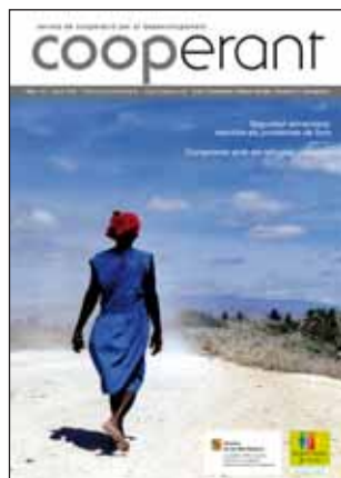
Haití