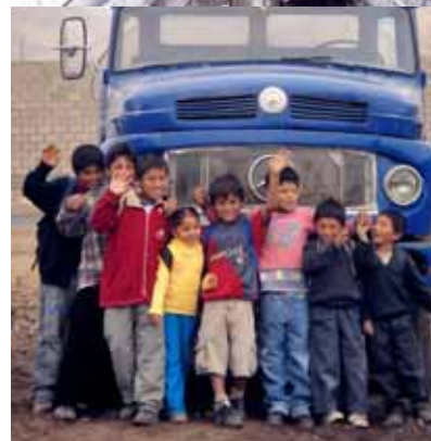
Associació de Llicenciats en Ciències Ambientals / Perú