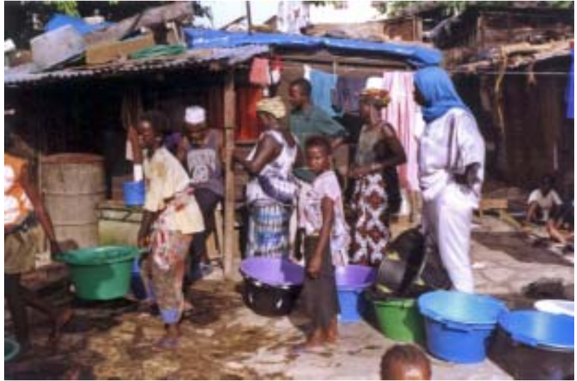
L'accés a l'aigua potable al barri de Xadim Rasul (Dakar) és una de les prioritats d'Enda. El acceso al agua potable en el barrio de Xadim Rasul (Dakar) es una de las prioridades de Enda.