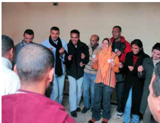
Barrios del Mundo / Marruecos