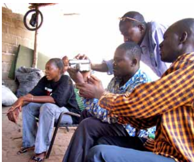
Barrios del Mundo / Senegal

Cartografia Social i la Perspectiva de Gènere. La metodologia de la Investigació-Acció-Participació, per exemple, facilita l'examen i la identificació, per part del col·lectiu de joves, dels problemes locals, així com el disseny d'estratègies per resoldre'ls. La Perspectiva de Gènere permet analitzar la transformació social provocada pels grups de dones als barris i les reconeix com a protagonistes d'un desenvolupament econòmic, social i polític més humà.