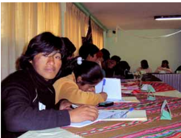
Barrios del Mundo / Bolívia

Los habitantes de estas barriadas proceden, en su mayoría, de zonas rurales o del extranjero, y han tenido que abandonar sus comunidades de origen por las difíciles condiciones económicas, los conflictos violentos o por desastres naturales. Sin embargo, en su nuevo destino, se sienten infravalorados y faltos de referencias locales o afectivas que les permitan integrarse y protegerse socialmente. En estos barrios, muchos jóvenes comparten la falta de oportunidades, el escepticismo y un fuerte sentimiento de exclusión.