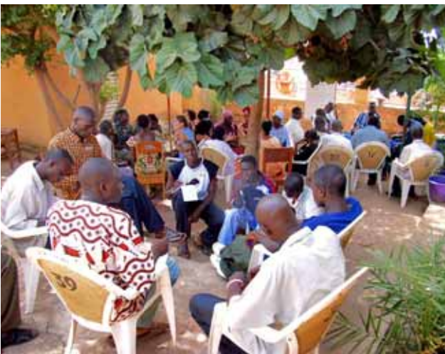
Barrios del Mundo / Senegal