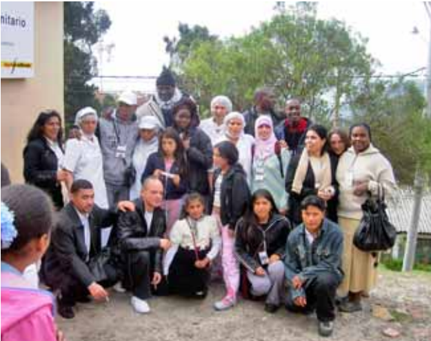
Barrios del Mundo / Colombia