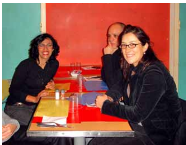
Barrios del Mundo / París

Per als nins i als joves el barri en què viuen és un dels primers i més importants referents per a la construcció de la seva identitat. D'aquí ve la preocupació de l'associació Quartiers du Monde i el seu projecte de cooperació internacional per combatre l'exclusió social i bastir ponts entre joves, associacions civils i autoritats locals, i aconseguir una governança més participativa. Es tracta de proveir de formació política i educació per a la participació ciutadana als joves, de manera que puguin mobilitzar-se i negociar amb altres habitants del barri i les autoritats locals amb la finalitat de resoldre els seus problemes i millorar la seva realitat.