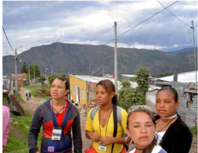
Barrios del Mundo / Colombia