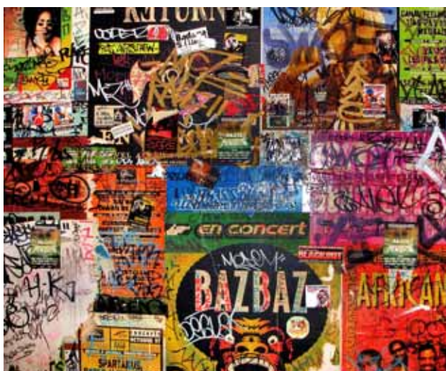
Barrios del Mundo / París