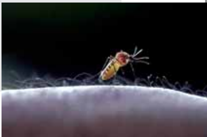
Stop Malaria Now!