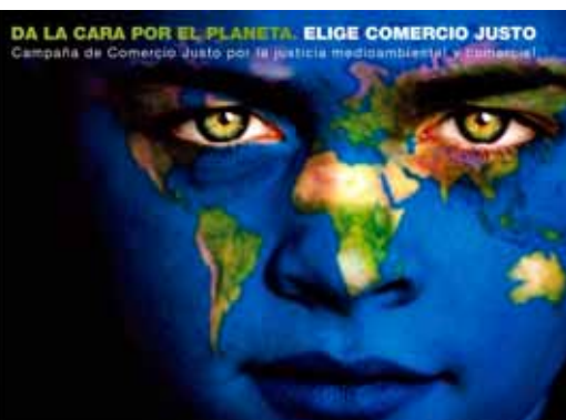
Coordinadora Estatal de Comercio Justo