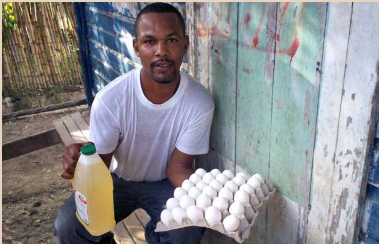
Asamblea de Cooperación por la Pau / República Dominicana

La escalada de precios en los alimentos básicos está golpeando duramente a la población más pobre del planeta. Las causas más evidentes: subida del petróleo, especulación con los productos agrícolas o producción de biocombustibles, encubren un estado de cosas dominado por las políticas agrícolas y comerciales proteccionistas de los países ricos.