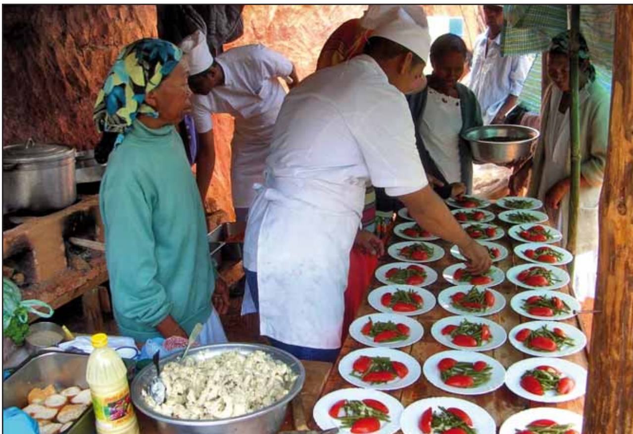
© OMT / Programa ST-EP / Madagascar

Un altre programa notable és el denominat Sendero de Chile, una ruta de 8.000 quilòmetres per a excursions, promogut pel Programa de les Nacions Unides per al Desenvolupament (PNUD), al voltant del qual han sorgit una dotzena de projectes gestionats per les comunitats de l'entorn.