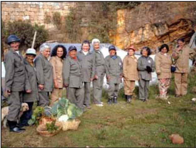
Grup d'Ornitologia Balear (GOB) / Colombia