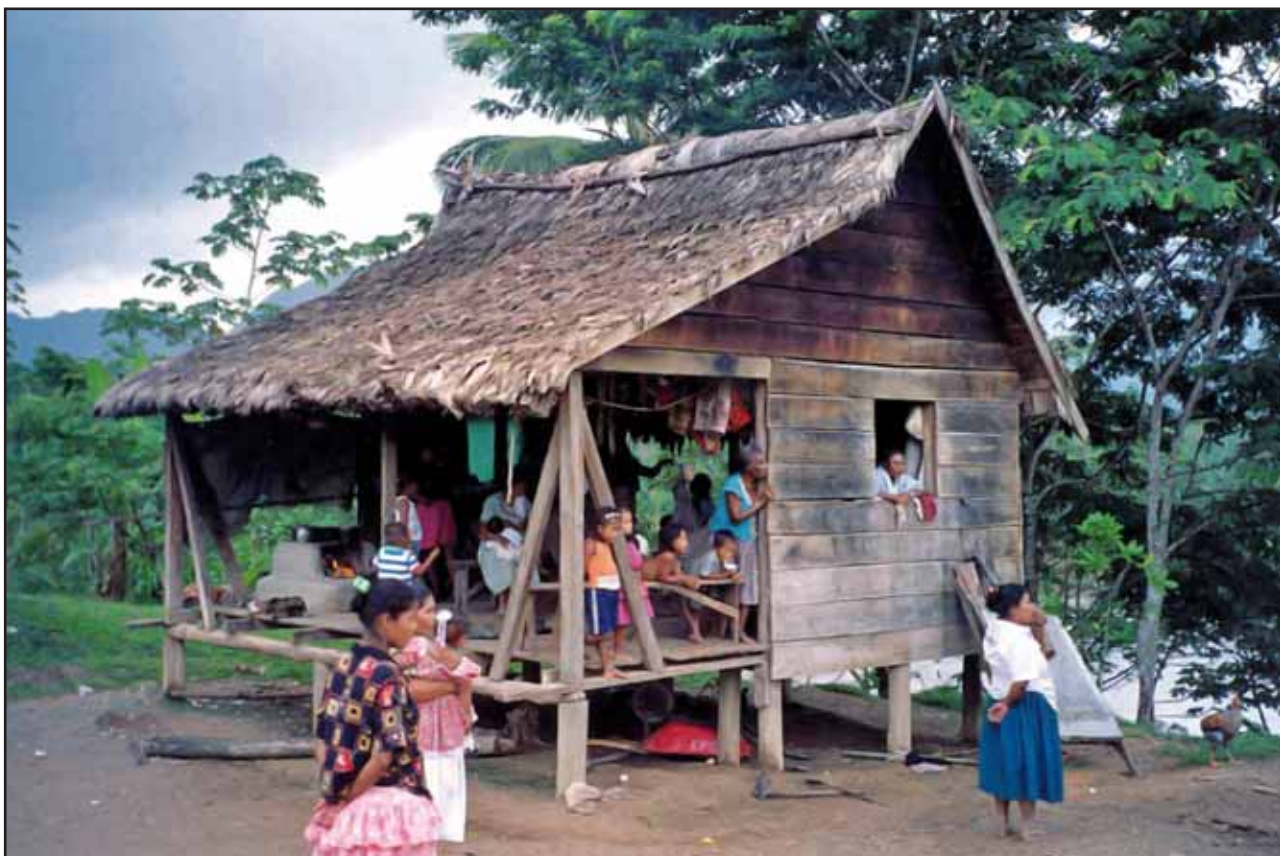
© EC / R. Canessa / Honduras

com a eina de desenvolupament. Moltes cadenes hoteleres, intermediaris turístics i companyies de transport, donen suport a programes d'ajuda al desenvolupament en les regions on operen. També, es dona el cas de grups turístics que promouen fundacions, com The Travel Foundation, que programa viatges sostenibles i executa projectes de desenvolupament local.