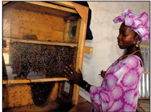
© The Travel Foundation / Beekeeping Project / Gambia

A més, és un tipus de turisme ideal per a la preservació d'àrees naturals, a la vegada que ocupa la població local en la prestació de serveis ambientals: protecció d'espècies, consolidació de corredors biològics, agricultura orgànica, protecció de conques hidrogràfiques, reforestació, promoció d'energies renovables, educació ambiental, etc.