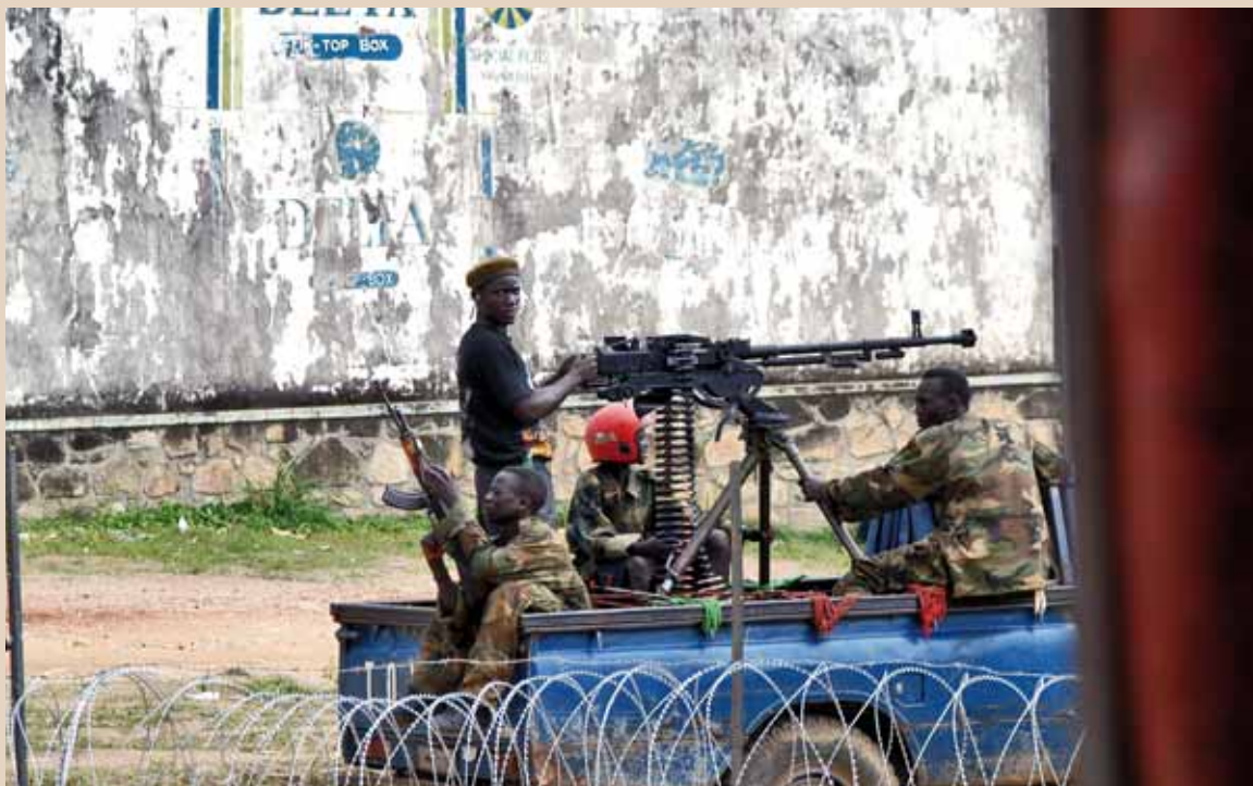
© EC / ECHO / François Goemans / República Democrática del Congo

Los medios de comunicación de masas ejercen una enorme influencia sobre nuestra percepción del mundo. La imagen que estos medios ofrecen sobre las sociedades de los países del Sur suele ser estereotipada y fragmentada.