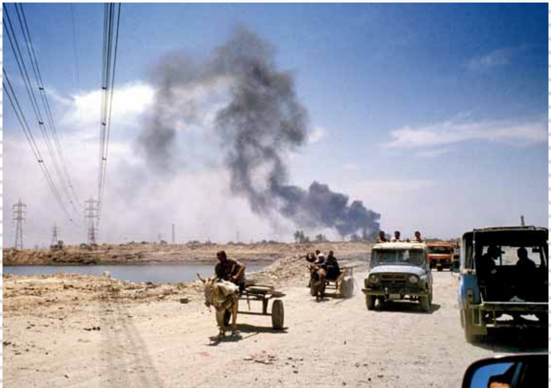
© EC / ECHO / Javier Menendez Bonilla / Iraq

El tractament dramàtic de la informació desencadena una reacció emocional que no afavoreix la reflexió