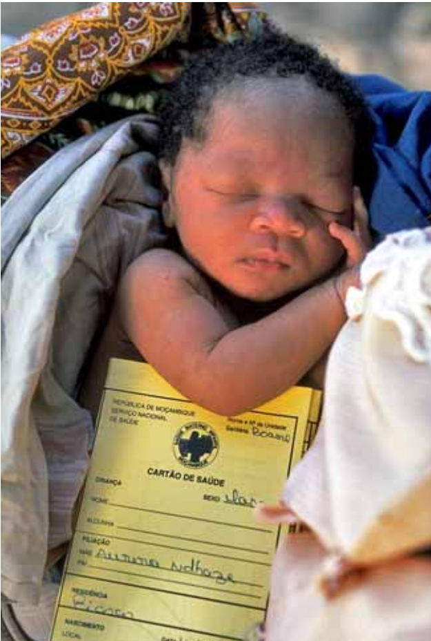
UNICEF / Giacomo Pirozzi / Mozambique

C. C.- En situaciones de crisis o emergencia, las medidas de impacto a muy corto plazo, pasan por responder con la máxima urgencia, llegar lo antes posible a la escena. En un contexto normalizado, contemplamos como actuaciones de impacto rápido la mejora de prácticas de atención familiar, que creemos que podrían evitar hasta un 40% de las muertes infantiles, tan sólo con la información adecuada y el apoyo y suministros básicos. Pensemos que en los países en desarrollo, en torno al 80% de la atención de la salud se presta en el hogar, que en muchas familias no se sigue una alimentación infantil apropiada y que no se practica la lactancia materna.