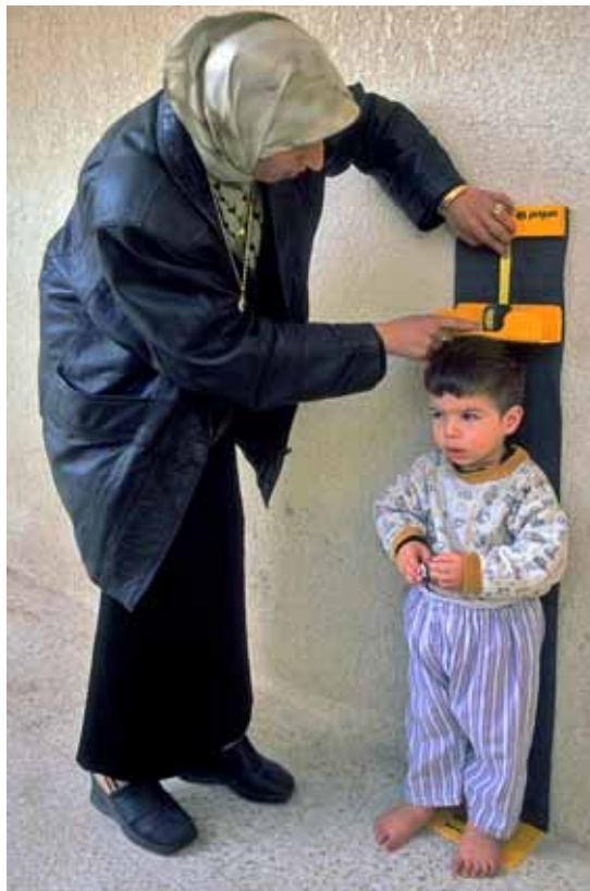
UNICEF / Shehzad Noorani / Iraq

Les dades sobre el progrés en l'ensenyament primari i la paritat entre gèneres situen a la cua l'Àsia meridional, amb 42 milions de nins sense escolaritzar (un 36,7%), seguida de l'Àfrica occidental i central (20,8%), i l'Àfrica oriental i meridional