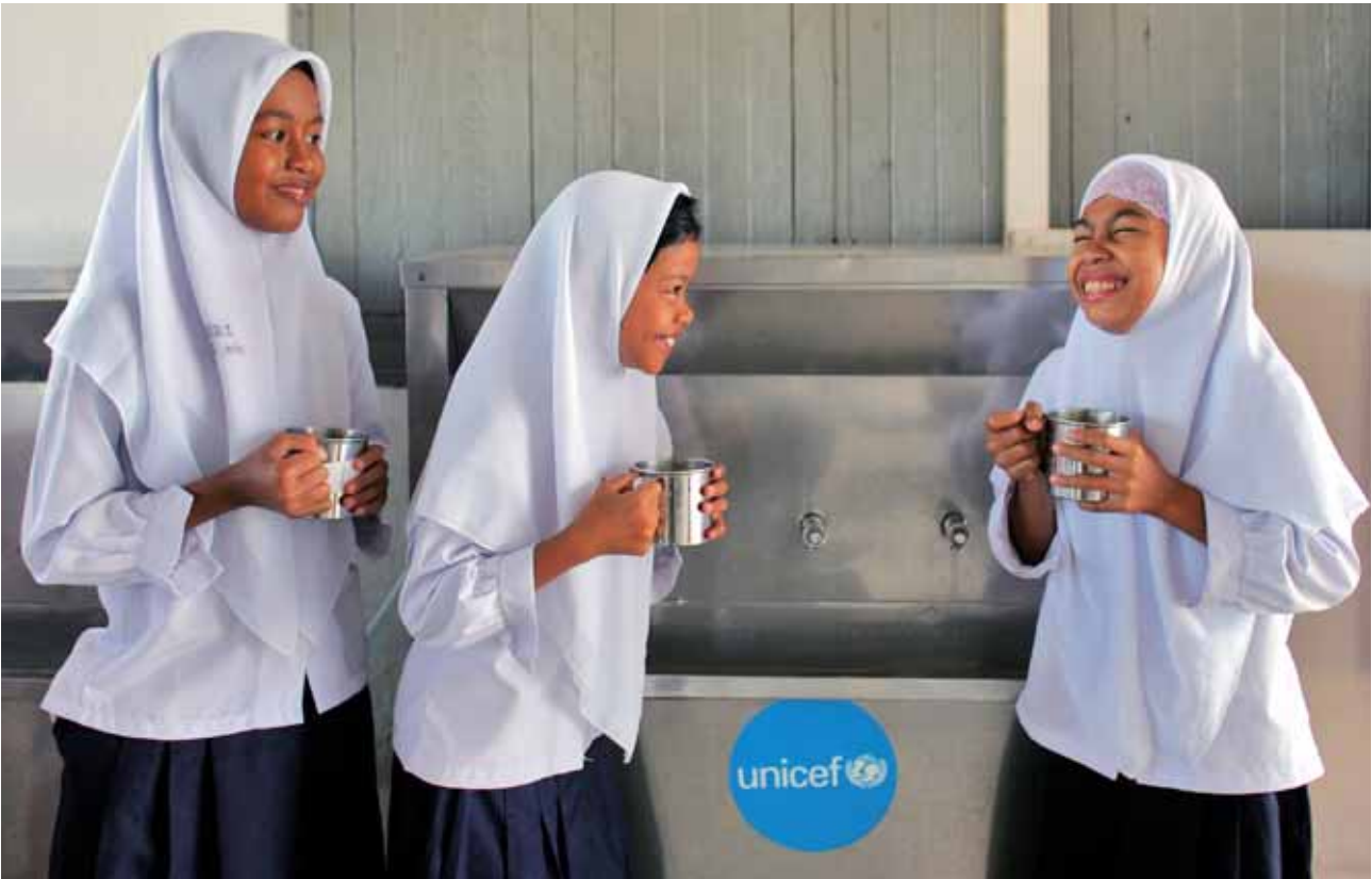
UNICEF / Josh Estey / Indonesia

També, l'informe posa de manifest que a pesar del fet que amb la recuperació econòmica a l'Europa sud-oriental i a la Comunitat d'Estats Independents (CEI) han millorat les condicions de vida de la majoria de la població adulta, molts de nins i nines no han rebut beneficis semblants.