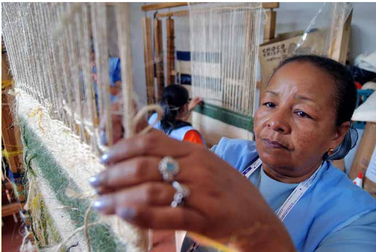
IOM / © Héctor Mauricio Moreno / Colombia

Es calcula que el 2005 les remeses representaren 172.000 milions d'euros (sense comptabilitzar els diners transferit a través de canals informals). Les dones migrants solen enviar una proporció més elevada dels seus ingressos que els homes, dirigits a alimentar, vestir, educar i pagar serveis de salut dels fills i familiars que deixaren enrere. A l'informe de l'UNFPA s'estima que les dones bengalís, treballadores a l'Orient Mitjà, enviaren a les seves comunitats d'origen una mitjana del 72% del seu salari, el 52% del qual destinat a les necessitats quotidianes, a assistència mèdica i a educació.