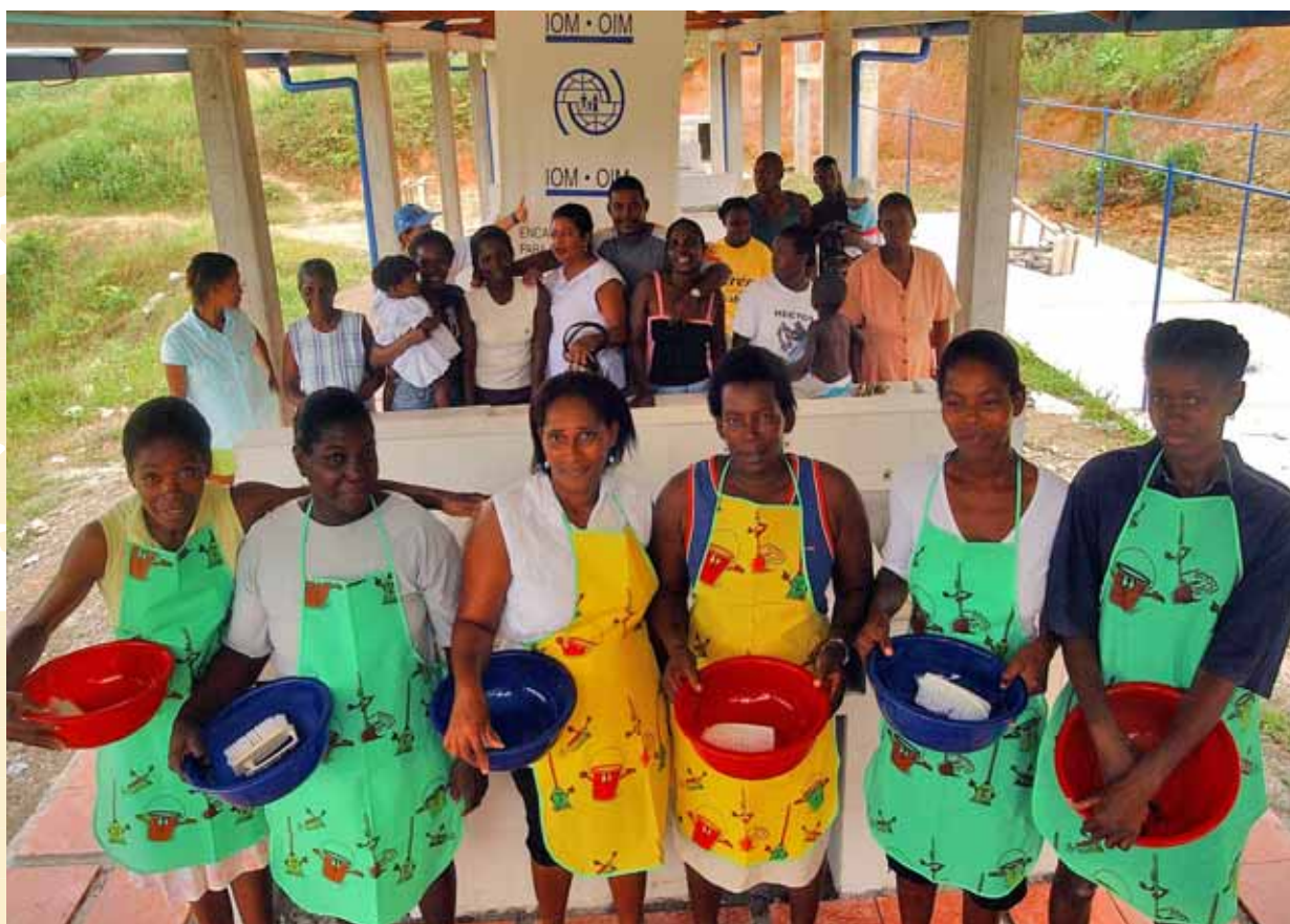
IOM / © Héctor Mauricio Moreno / Colombia