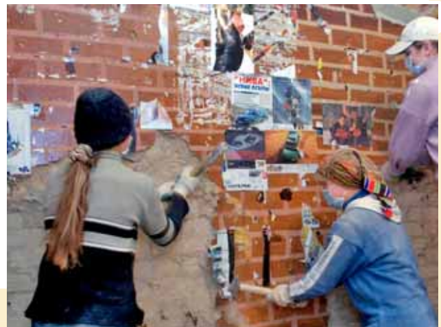
© OIT / M. Crozet / Rusia

Latinoamèrica, tradicionalment destinatària d'importants fluxos migratoris és, actualment, el bressol del 13% dels migrants internacionals, la meitat dels quals són dones. La migració femenina llatinoamericana es dirigeix principalment cap als països fronterers més desenvolupats, els Estats Units, Espanya i el Japó, mentre que a Àsia i Àfrica els corrents migratoris es produeixen principalment a l'interior d'aquests continents.