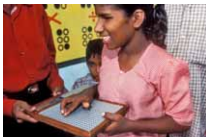
Fundación Vicente Ferrer

instancias políticas, la igualdad no se ha alcanzado. En las zonas rurales, dos tercios de los dalits son analfabetos y sólo la mitad de agricultores poseen tierras. Muchos de ellos, incluidos niños, son trabajadores forzados esclavizados por las deudas.