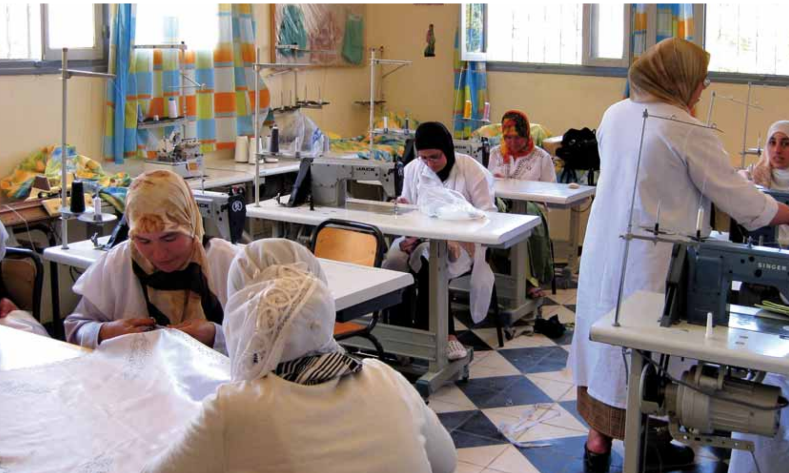
© Pau de Vilchez / Direcció General de Cooperació