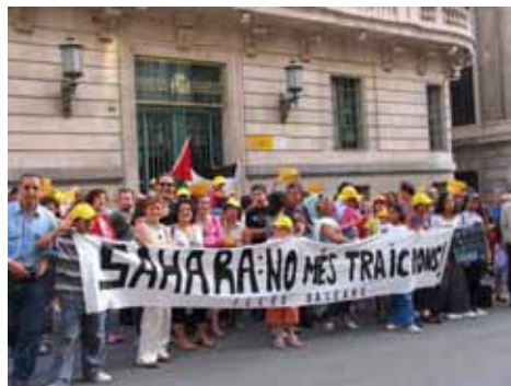
Associació d'Amics del Poble Sahrauí de les Illes Balears

diverses jornades d'informació sobre aquest aspecte, gairebé amagat a l'opinió pública, de l'intent d'annexió del Sàhara Occidental, com per exemple els acords signats per la Unió Europea sobre pesca amb el Marroc, on es negocien els bancs de pesca sahrauís!