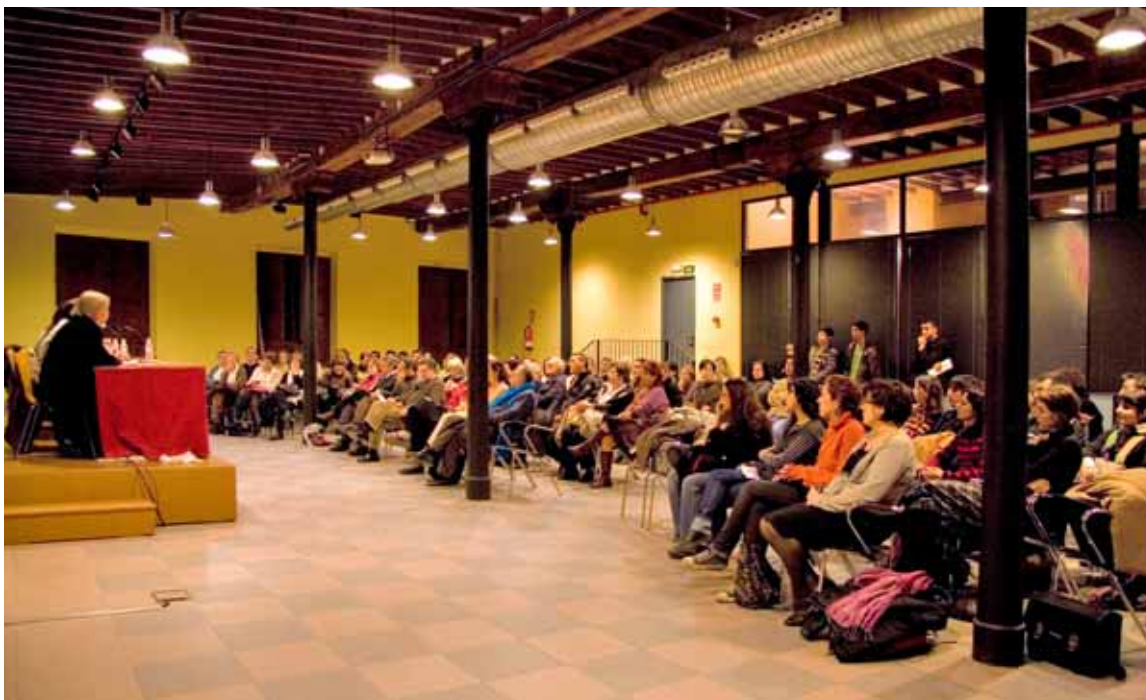
Associació d'Amics del Poble Sahrauí de les Illes Balears

a Ginebra. El departament de Drets Humans de la nostra Associació és el corresponsal, a l'Estat espanyol, de la BIRDHSO i s'encarrega de traduir la carta del mes i de remetre-la a les famílies "adoptants", amb tota la informació disponible. És responsable també de la traducció i distribució de la revista de l'Oficina de Ginebra El Karama .